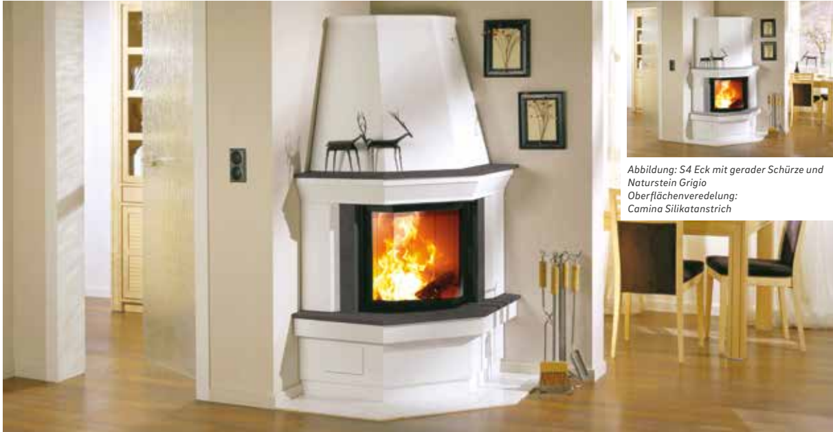
Abbildung: S4 Eck mit gerader Schürze und Naturstein Grigio Oberflächenveredelung: Camina Silikatanstrich